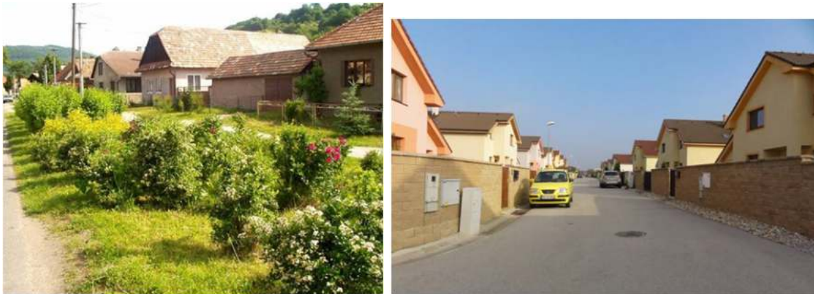
Obr. 5 Kontrast medzi pôvodnou a novodobou ulicou