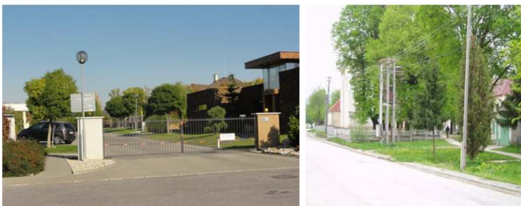
Obr. 4 Privatizácia uličného priestoru spôsobuje územné bariéry; nežiaduca konkurencia dominant obce s prvkami technickej infraštruktúry

Súčasťou transformácie verejných priestorov je aj ich „dekomunizácia“ sprevádzaná premenovaním miestnych názvov a ulíc, spontánne aktivity odstraňovania nežiaducich sôch a iných symbolov spojených s predchádzajúcim politickým systémom.