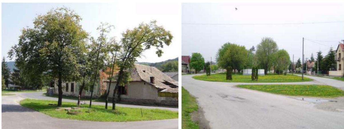
Obr. 2 Verejné priestory, ktoré síce podčiarkujú pokojnú atmosféru vidieckeho prostredia, ale postrádajú atraktívne aktivity, ktoré priťahujú obyvateľov - obce Bulhary a Ludanice