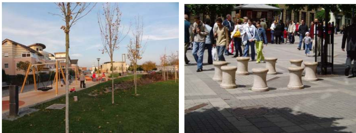
Obr.7 Prvky drobnej architektúry, ktoré dotvárajú úžasný kolotoč pohybu a aktivít vo verejnom priestore – obec Zálesie a mesto Győr v Maďarsku