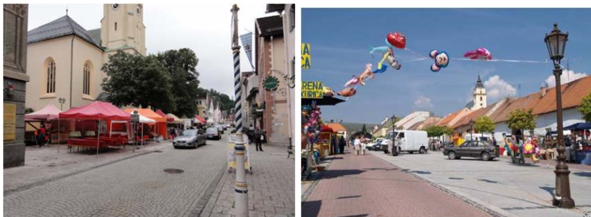
Obr. 6 Živé verejné priestory, ktorých súčasťou je trhovisko, obchodná vybavenosť, reštaurácie a kaviarne s posedením – obce Scharnitz a Rust v Rakúsku

Plánovanie verejných priestorov je náročný proces, pri ktorom sa ukazuje, že najdôležitejšou cestou, ako predísť budúcim problémom, je zapojenie verejnosti už vo fáze prípravy projektu. Samospráva aj miestne authority sa poučili, že spoluúčasť obyvateľov na plánovaní a rozhodovaní je cesta jednoduchšia, ako následné kritiky, protesty a petície. Prenesenie názorov a návrhov súčasných a budúcich užívateľov do tvorby verejného priestoru je úloha architektov za aktívnej spoluúčasti lokálnych aktérov. Všetci účastníci, vrátane občanov, by sa mali pri debatách o návrhu námestia stotožniť s názorom prof. Šarafina: „Na námestí musíme pocítiť silné žiarenie, s pozitívnym účinkom, nie je to len o vybudovaní priestranstva, je to o výsledku diskusného procesu ako skúšky kultúrnosti obce, ide o stavebnú kultúru obce, je to o naliehavosti pozitívnej identity obce a novej interpretácii silných koreňov, diskusia o tvorbe pravdivých znakov nie len lacných atrakciách“ [4].