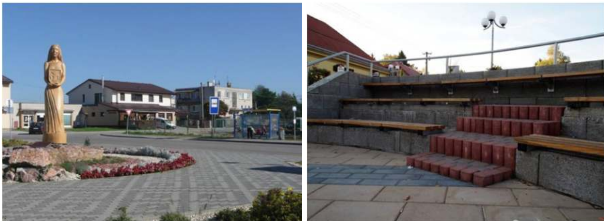
Obr. 3 Negatívne príklady rekonštrukcie verejných priestorov, ktoré sa vyznačujú nesúrodosťou použitých stavebných materiálov - obce Beluša a Pruské

Proces obnovy vidieka po roku 1989, pretrvávajúcu „stabilitu“ vo vidieckych sídlach postupne narúša pretváraním a rekonštrukciou pôvodnej zástavby. Rôznorodosť a neopakovateľnosť hlavných vidieckych verejných priestorov, so špecifickou štruktúrou, sa urbánnymi zásahmi mení. Rozmach rekonštrukcie vidieckych verejných priestorov, stimulovaný eurofondami, je nesporne pozitívnou zmenou, ktorá im vtlačá nové „ošatenie“. Jednotlivé intervencie sa výrazne líšia – od jedinečných riešení, ktoré oživujú tradície, podčiarkujú autenticitu miesta a zvyšujú prítlačivosť celkového obrazu lokality, až po negatívne, vyznačujúce sa uniformitou, stieraním regionálnych rozdielov, pôvodnej znakovosti a stratou originality priestoru „génia loci“. Pri nevhodnom návrhu môže vidiecky priestor nadobudnúť znaky uniformného prostredia, ktoré sa vyznačuje použitím rovnakých výrazových prostriedkov, tvarov, materiálov aj farebnosťou, čím obce nadobúdajú jednotný výraz, strácajú atmosféru, identitu, pocit svojráznosti a jedinečnosti. Žiaľ dôležitú úlohu v tomto procese zohrávajú finančné možnosti, ktoré sú regulované dotáciami. Výsledná kvalita remeselného prevedenia povrchových úprav verejných priestorov, ako aj výber prvkov drobnej architektúry, v mnohých realizáciách neprispieva k ich funkčnosti, atraktivnosti a trvácnosti (obr. 3).